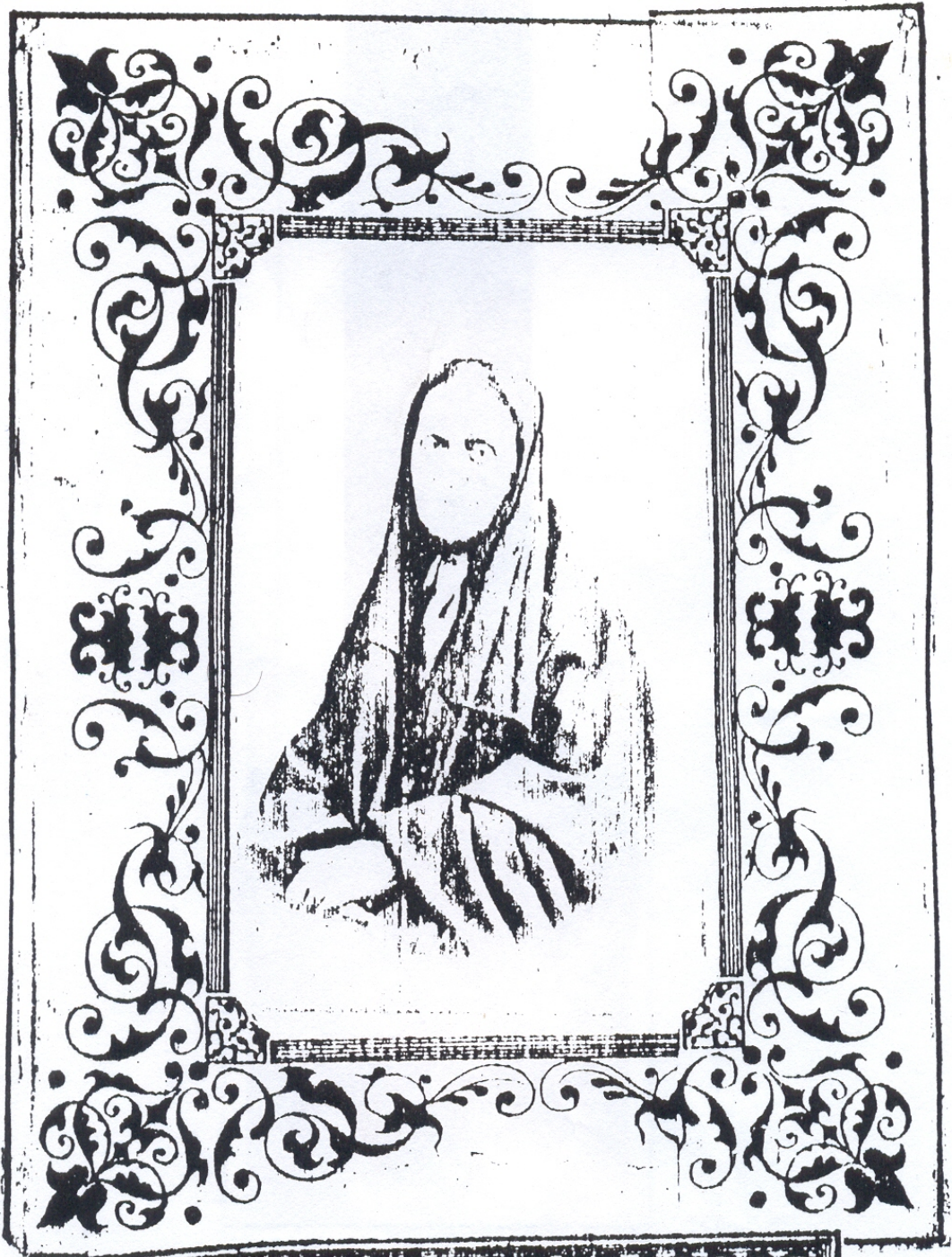
La autora del cuadro de esta Ermita