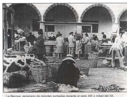
La Recova, escenario de grandes luchadas durante el siglo XIX y mitad del XX.